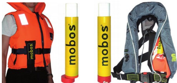
Segnalatore MOBOS® MTX-M con interruttore manuale

In alternativa può essere attaccato con una sacca a qualsiasi giubbotto di salvataggio.